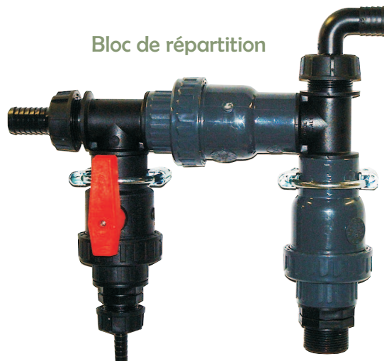
Bloc de répartition